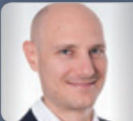
Dr. Pesendorfer Richter LG für ZRS Wien