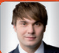
RA Dr. Lampert Baurechts- Experte WOLF THEISS Rechtsanwälte GmbH & Co KG