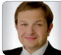
RA Mag. Schender Rechtsanwalt & Partner B&S Böhmdorfer Schender RAe