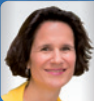
FH-Prof. DI Dr. Link Department Bauen & Gestalten ECC GmbH / FH Campus Wien