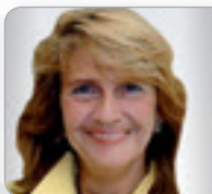
RA Dr. Steiner Vergaberechts- Expertin DSC - Doralt Seist Csoklich