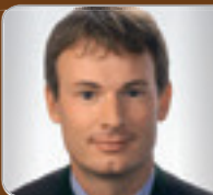
DDI Mag. Schmied, MSc Ziviltechniker & Sachverständiger Ziviltechnikerbüro IKTech