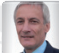
Univ.-Lekt. DI Dr. Wisser Allgem. beeid. & gerichtl. zert. SV buildINGSUCCESS ZT GmbH