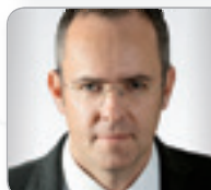
DI Dr. techn. Werkl Bauwirtschaft- liche Beratung profacto.GmbH