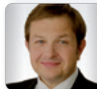
RA Mag. iur. Schender Rechtsanwalt & Partner B&S Böhmendorfer Schender RAe