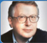
Prof. DI Dr. Bruck Ingenieur- konsulent Allg. beeid. & gerichtl. zert. SV