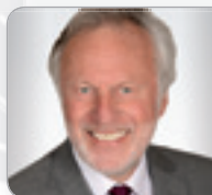
WT/StB Ing. Mag. Stingl Immobilien- verwalter Stingl Top Audit GmbH & Co KG