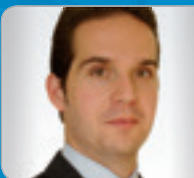
Bmstr. DI Steinbauer Immobilien-Experte Steinbauer Bau- & Immobilien- treuhand GmbH